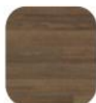
Am. Notelaar Style