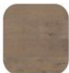
eik Kristall Crack