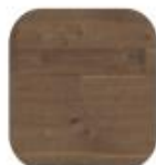
Am. Notelaar Karakter