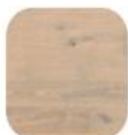
eik Saphir Karakter