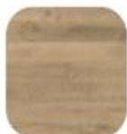
eik Diamant Karakter