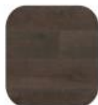
eik Granat Crack