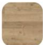
eik Calcit Pure Karakter