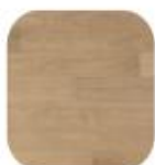
eik Calcit Pure Style