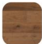
eik Bronze Karakter