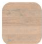
eik Saphir Crack