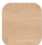
eik Saphir Style