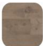
eik Kristall Karakter