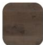
eik Granat Karakter